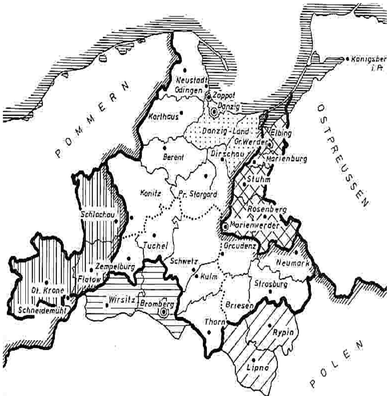
Karte der Provinz Westpreußen von 1878 – 1920