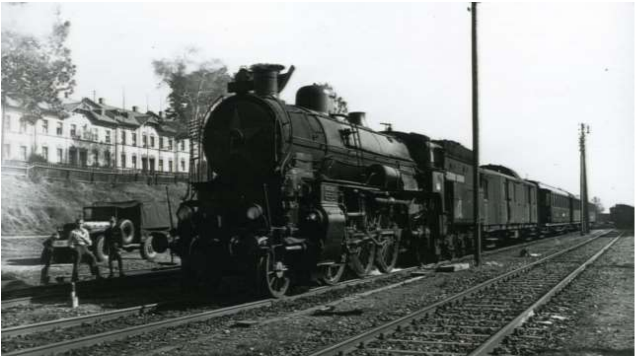
Fluchtzug in Selb-Plößberg

Am 11. September 1951 flüchteten 27 tschechoslowakische Bürger mit einem Personenzug in die BRD. Die Organisatoren der Gruppenflucht leiteten den Zug illegal bei Aš über die Staatsgrenze nach Bayern um. Sie hatten sich zuvor im antikommunistischen Widerstand engagiert. Der Zug hielt ein Stück vor dem Bahnhof Selb-Plößberg. Für die Asylanten und 90 andere Personen, die in dem Zug mitfuhren, war die Reise damit jedoch nicht zu Ende. Zum 70. Jahrestag wurde bei einer deutsch-tschechischen Veranstaltung auf dem Hauptbahnhof von Aš an den Freiheitszug erinnert. Im Folgenden ein Bericht über die einzigartige Fluchtaktion und die Gedenkveranstaltung.