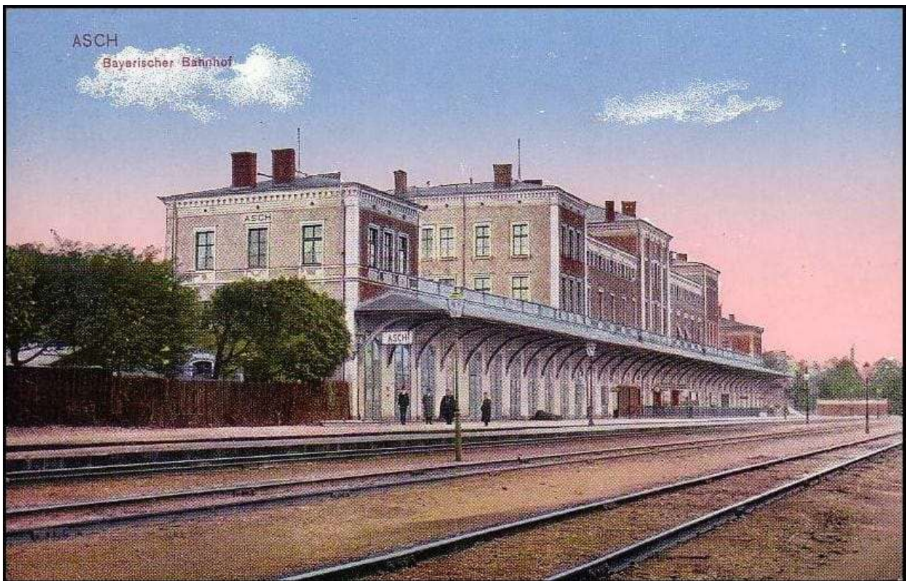
Bayerischer Bahnhof Asch um 1930

„Da waren große Lampen, die einen anstrahlten, in der Mitte ein Tisch und ein Stuhl. In jeder Ecke des Raumes stand ein Mann im Halbdunkel. Und aus allen vier Ecken prasselten Fragen auf mich ein. Ich habe noch heute ein Gefühl panischen Schreckens, wenn ich daran zurückdenke“, so die Zeitzeugin über die Verhöre.