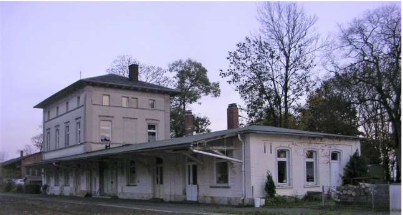
Bahnhof Selb-Plößberg.

Weitere Informationen hat die Autorin des Beitrags auf der Website https://www.freiheitszug-vlak-svobody.org veröffentlicht.