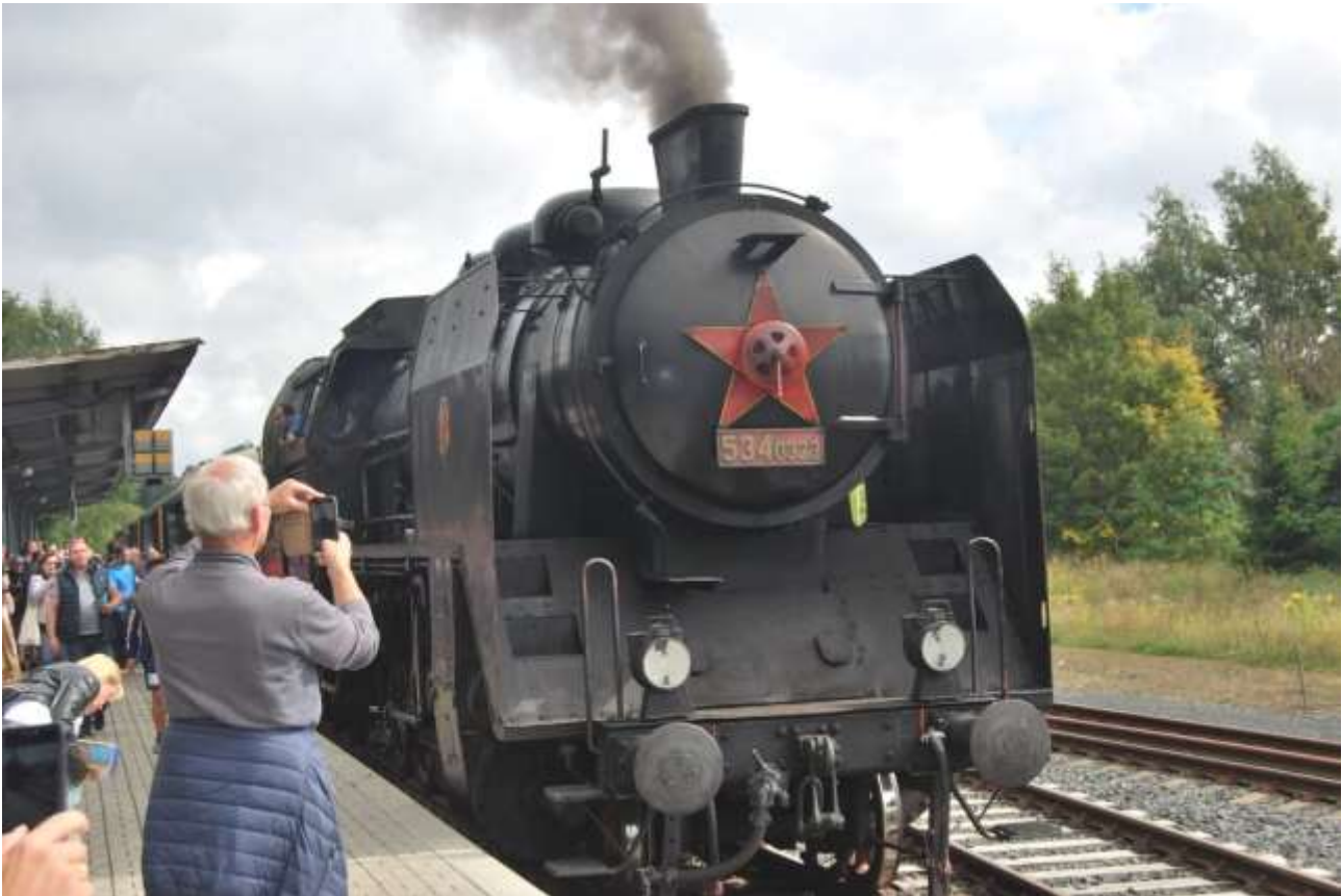
Historische Dampflokomotive am Hauptbahnhof Asch 2021.

„Mit der Samtenen Revolution fiel die ersehnte Freiheit wie ein Kugelblitz bei uns ein. Eine wunderbare Freiheit, die jedoch auch gefährlich ist. Vor allem aber zwingt sie uns, selbst zu entscheiden, was gut und was schlecht ist. Niemand schreibt uns das vor, doch es hilft uns auch niemand dabei. Alles hängt nun allein von uns ab.“