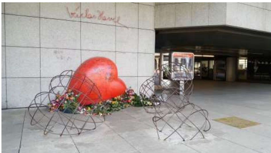
Herz für Václav Havel

Das zehn Meter hohe Objekt, das in diesem Jahr auf dem Prager Vítězné náměstí (Siegesplatz) steht, symbolisiert die „Raupe des frühen Kapitalismus“ in der Tschechischen Republik. Kurt Gebauer, Bildhauer und Bewohner des sechsten Stadtbezirks, entwarf das Werk 1997 als Reaktion auf die „blöde Stimmung“ der damaligen Zeit. Die Raupe befindet sich genau an der Stelle, an der vor 30 Jahren ein Lenin-Denkmal entfernt wurde.