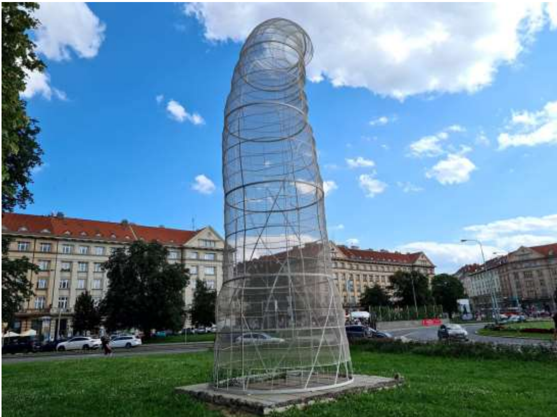
Kurt Gebauer: „Raupe des frühen Kapitalismus“.- Foto: Klára Stejskalová, Radio Prague International