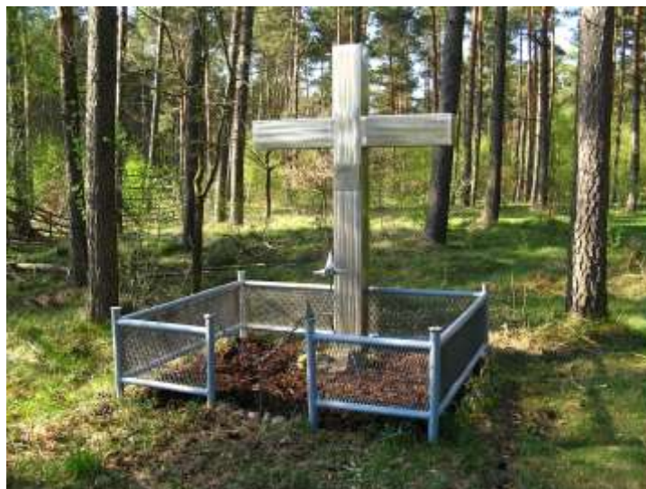
Gedenkkreuz am Todesort Michael Gartenschlägers an der ehemaligen innerdeutschen Grenze, Blickrichtung Schleswig-Holstein

Nach dieser Tat existierte die DDR noch etwa 14 Jahre. Gartenschlägers Spuren wurden während dieser Zeit möglichst ausgetilgt. Nach der Wende dauerte es dann fast zehn Jahre, bis den Todesumständen erstmals juristisch nachgegangen wurde. Die Täter wurden im Frühjahr 2000 von dem Vorwurf des versuchten Mordes freigesprochen.