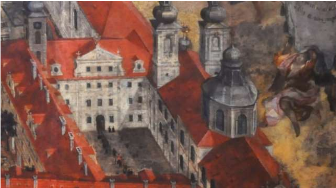
Johann Hiebel: Klementinum (1750)