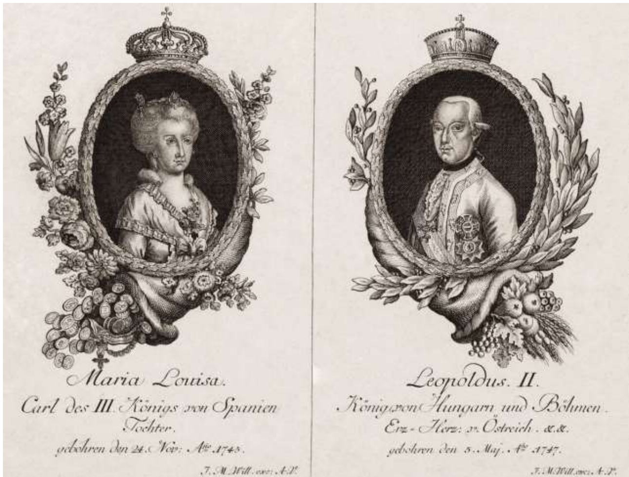
Maria Ludovica von Spanien und Leopold II.

Leopold II. besuchte die Industriemesse gemeinsam mit seiner Gemahlin Maria Ludovica von Spanien sowie seinem Gefolge am 14. September 1791. Die Zeitungen schrieben damals, dass sich die beiden Majestäten sogar länger im Klementinum aufhielten als am Vortag bei der feierlichen Sitzung der „Königlichen böhmischen Gesellschaft der Wissenschaften“ – und das ohne jegliche Anzeichen von Langeweile.