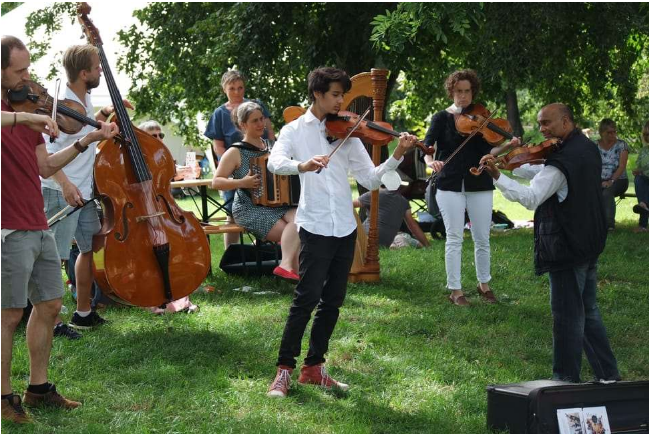
Zur guten Stimmung beim deutsch-tschechischen Picknick trug auch die Kulturgruppe „Rohrer Sommer“ bei.