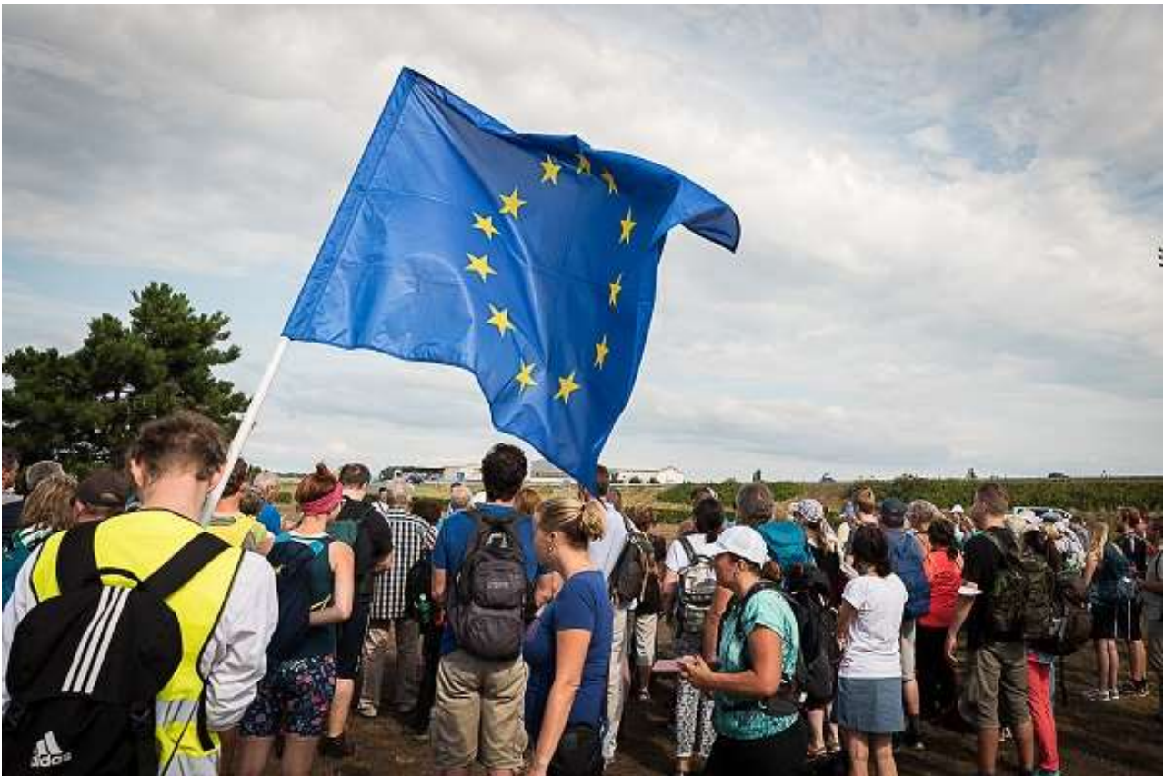
Versöhnungsmarsch von Pohrlitz nach Brünn

"Es ist lächerlich, dass Menschen unter dem Eindruck von Büchern, Gemälden, Theater weinen und unverblümt durch das wahre Elend laufen können" - dieses Zitat der tschechischen Widerstandskämpferin Marie Kudeříková (1921-1943) war Inspiration für die Performance "Tanz Gemälde Maruška", mit der das Festival "Meeting Brno 2021" zu Ende ging. Mit der Abschlussveranstaltung wurde bewusst eine Brücke von der Vergangenheit ins Heute geschlagen. 20 verschiedene Veranstaltungen arbeiteten im diesjährigen Festival die jüngere Geschichte der Stadt Brünn auf, insbesondere jene des deutschsprachigen und jüdischen Teiles der Bevölkerung.