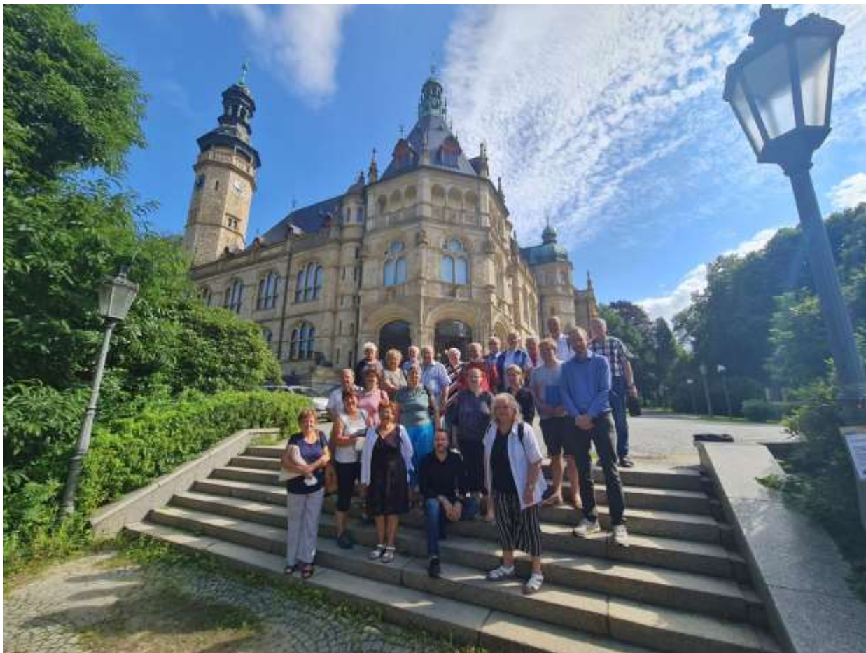
Die Teilnehmer vor dem Nordböhmischen Museum in Reichenberg