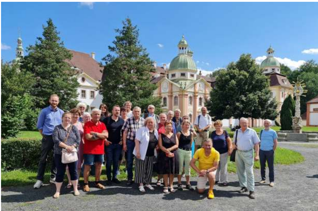
Gruppenbild vor dem Kloster Marienthal an der Neiße