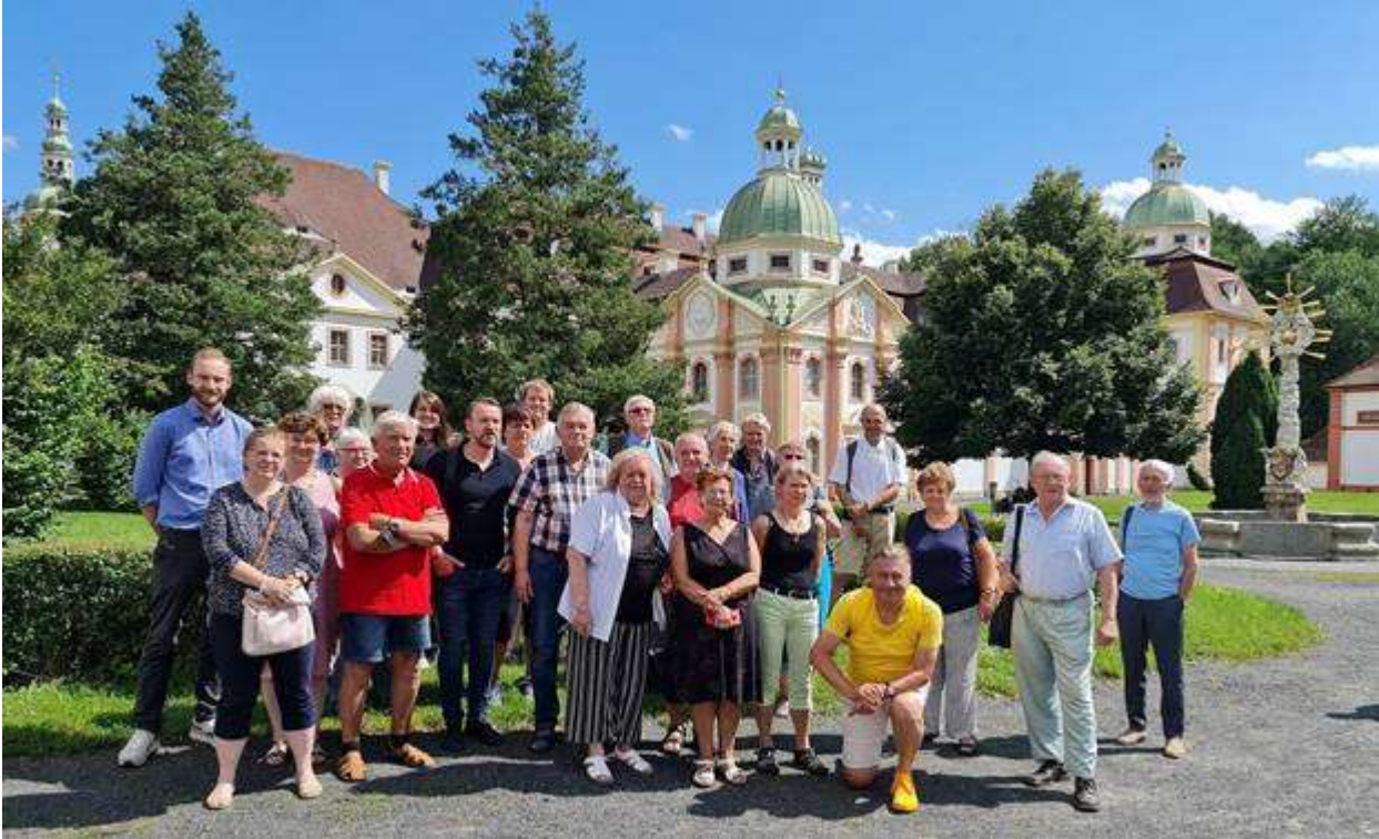
Die Teilnehmer vor dem Zisterzienserkloster Marienthal an der Neiße.

Wie in jedem Jahr organisierte die Landesversammlung der deutschen Vereine in der Tschechischen Republik (LV) auch 2021 für Vertreter der deutschen Verbände und Vereine ein Bildungsseminar, das am vergangenen Wochenende in Reichenberg / Liberec stattfand. Die Themen waren die Antragstellung für Projekte im nächsten Jahr sowie die Lausitzer Sorben .