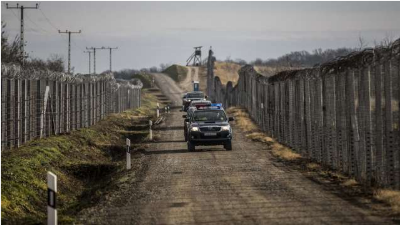
Zaun an der Südgrenze Ungarns - Bildquelle: Magyar Nemzet/Árpád Kurucz