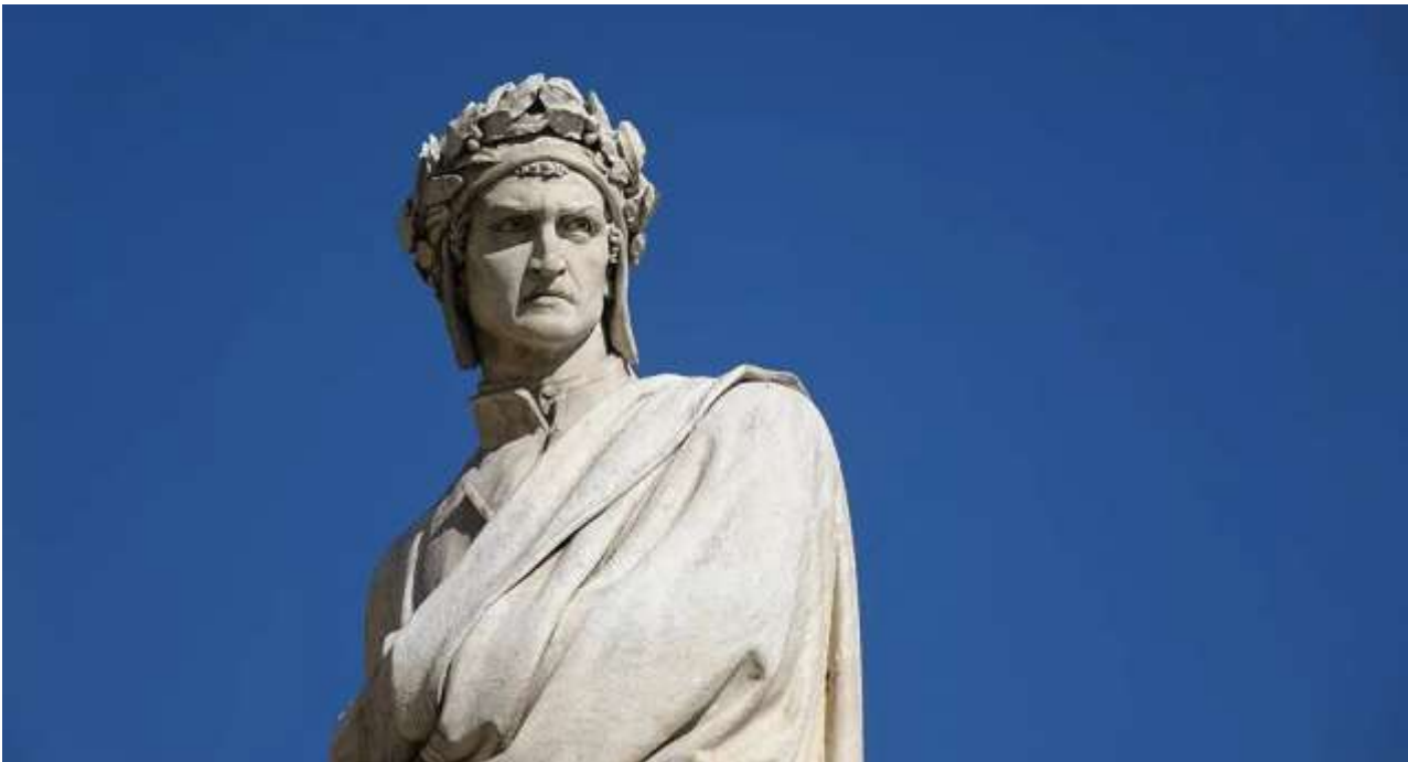
Dante-Denkmal auf der Piazza Santa Croce in Florenz, Enrico Pazzi (1865)

In einer niederländischen Übersetzung von Dantes Göttlichen Komödie wurde die Figur des Mohammed entfernt, der in einem der neun Kreise der Hölle bestraft werden soll. Ein Schritt, der in der Öffentlichkeit nicht unwidersprochen blieb.