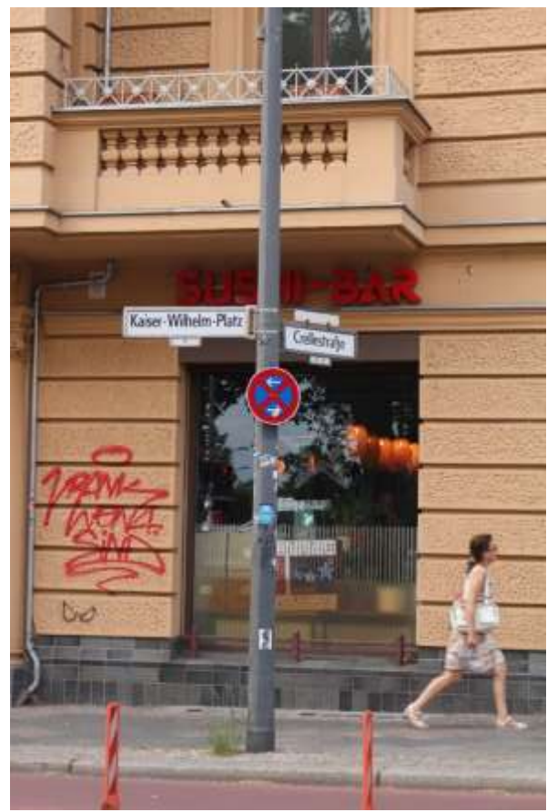
Kaiser-Wilhelm-Platz Ecke Crellestraße (im linken Bild die Hauptstraße links hinten)