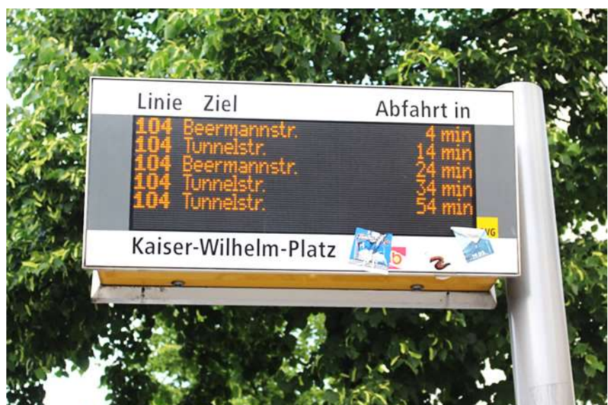
Kaiser-Wilhelm-Platz: mehr als fünf Buslinien fahren den Platz an...