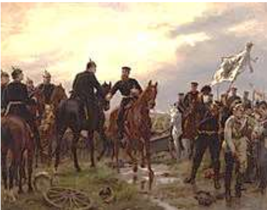
Nach der Schlacht bei Königgrätz, Gemälde von Emil Hünten , 1886