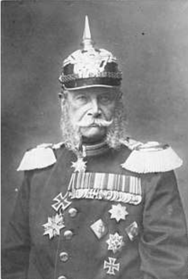
Wilhelm I. in Uniform mit Orden und Pickelhaube , 1884

Wilhelm akzeptierte aber letztlich, dass die Politik des neuen Deutschen Reiches von Bismarck bestimmt wurde. Das zeigen ihm zugeschriebene Aussprüche wie „Bismarck ist wichtiger“ oder: