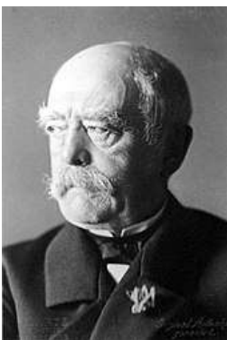
Otto von Bismarck