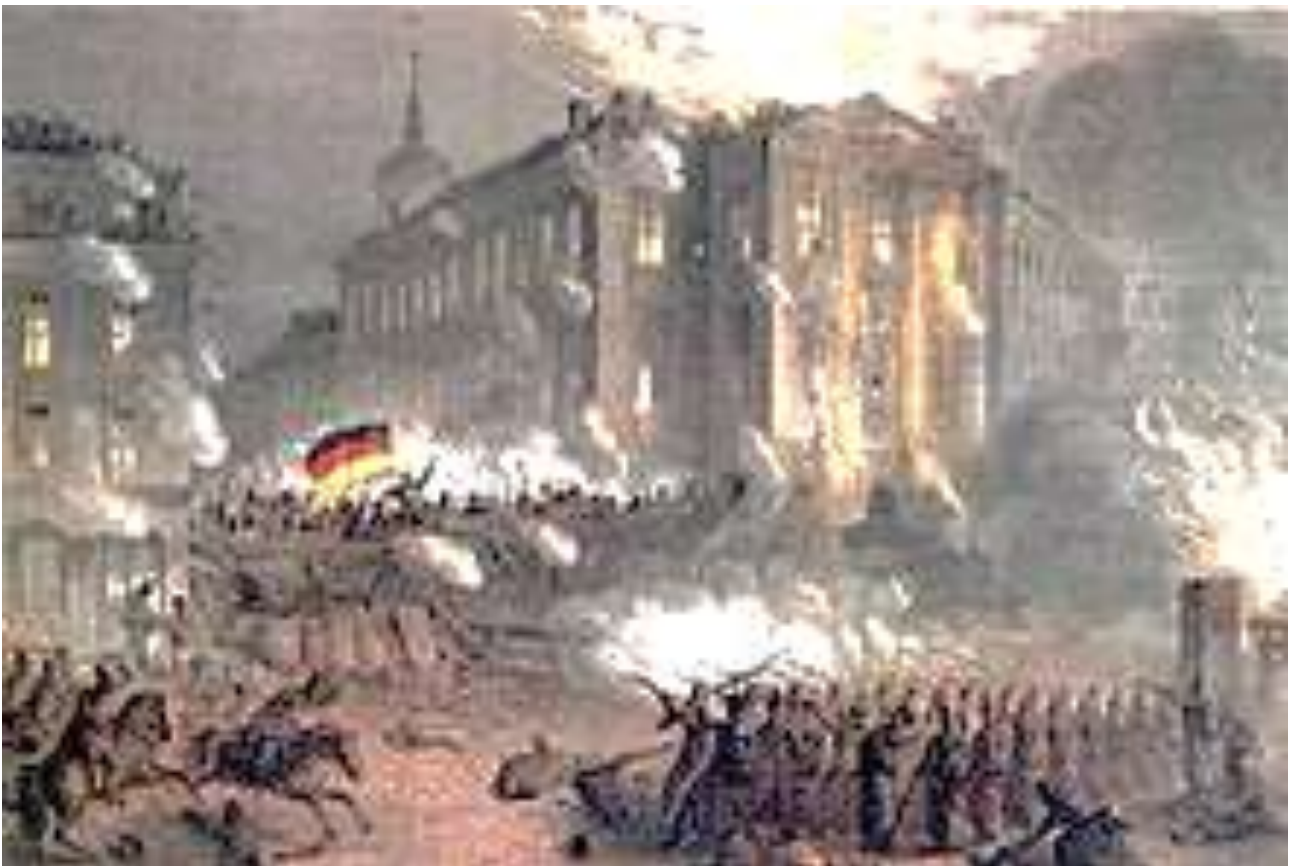
Märzrevolution 1848 in Berlin