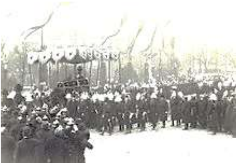
Trauerzug für Wilhelm I. im Berliner Lustgarten , 1888

Wilhelm, der im hohen Alter hohe Popularität genoss und für viele das alte Preußen verkörperte, starb nach kurzer Krankheit im Dreikaiserjahr am 9. März 1888 im Alten Palais Unter den Linden und wurde am 16. März im Mausoleum im Schlosspark Charlottenburg beigesetzt.