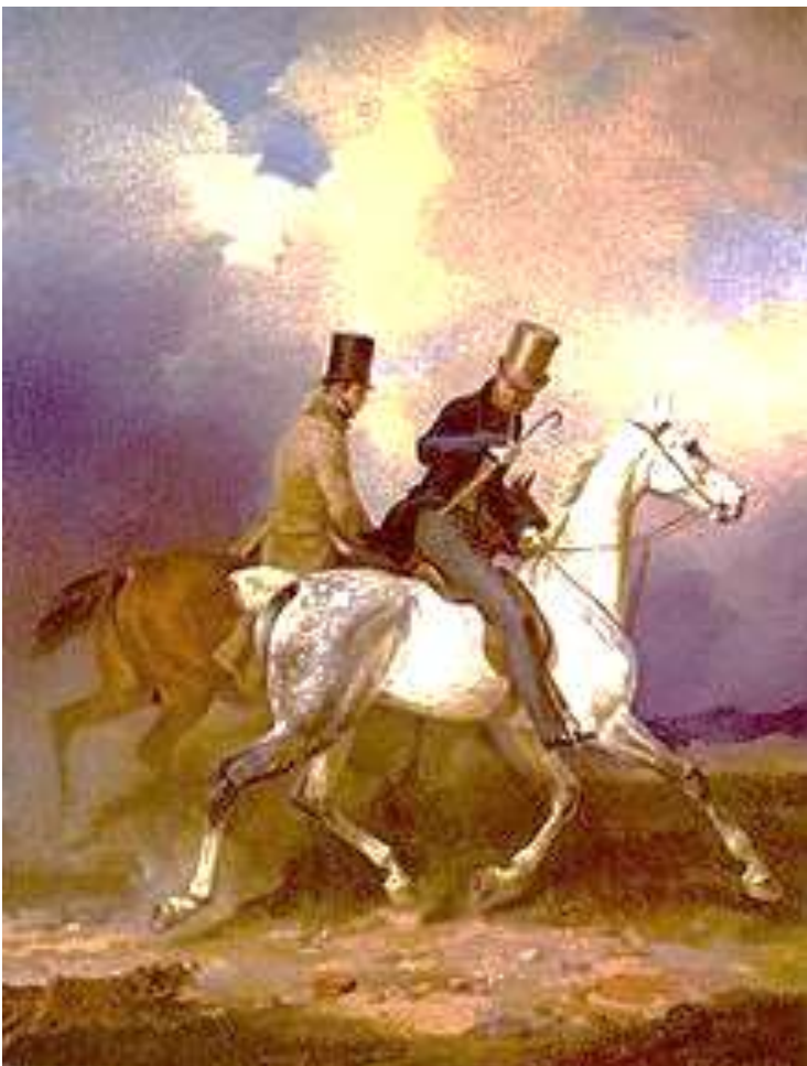
Ausritt des Prinzen Wilhelm von Preußen in Begleitung des Malers, Gemälde von Franz Krüger , 1836