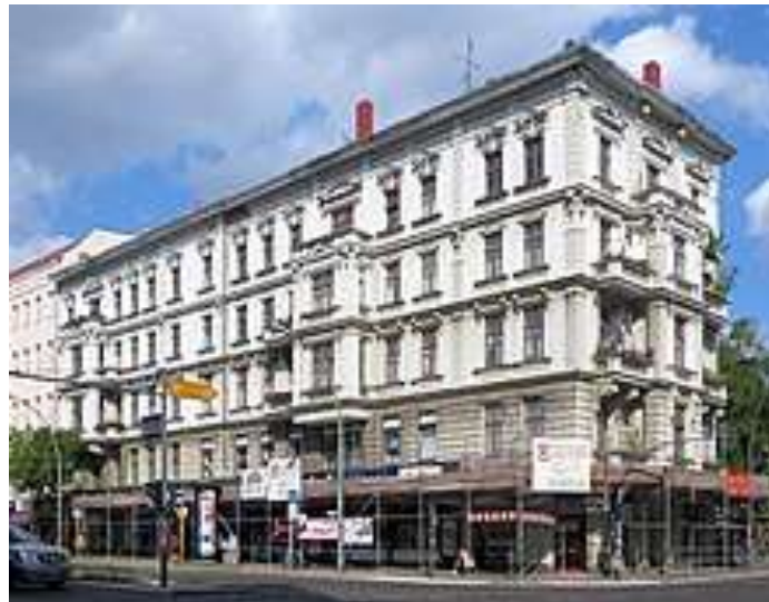
Kaiser-Wilhelm-Platz 5; Juli 2013