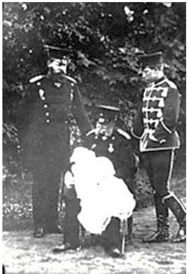
Kaiser Wilhelm I. mit Sohn, Enkel und Urenkel, 1882