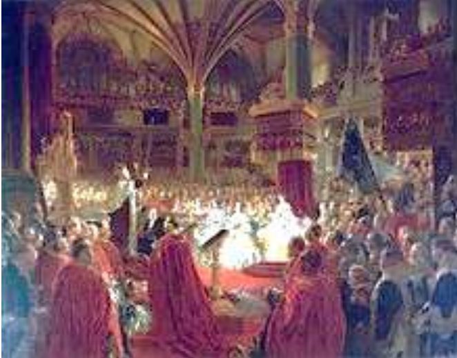
Krönung Wilhelms I. zum König in Königsberg, Gemälde von Adolph Menzel , 1861

Nach dem Tod seines Bruders Friedrich Wilhelm IV. am 2. Januar 1861 bestieg Wilhelm den preußischen Thron. Mit der von ihm selbst auf eigene Kosten veranstalteten Krönung meinte Wilhelm einen Kompromiss zwischen der nicht in der Verfassung vorgesehenen, aber von ihm gewünschten Erb huldigung , und der dort vorgeschriebenen Eidesleistung im Parlament gefunden zu haben. [10] Im Aufruf an mein Volk vom 8. Januar 1861 bekräftigte er seine Treue zum Eid auf die Verfassung, den er bereits 1858 als Prinzregent abgelegt hatte. Am 18. Oktober 1861 fand die prachtvolle Krönungsversammlung in Königsberg in der Schlosskirche statt.