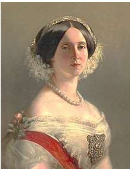
Augusta von Sachsen-Weimar-Eisenach