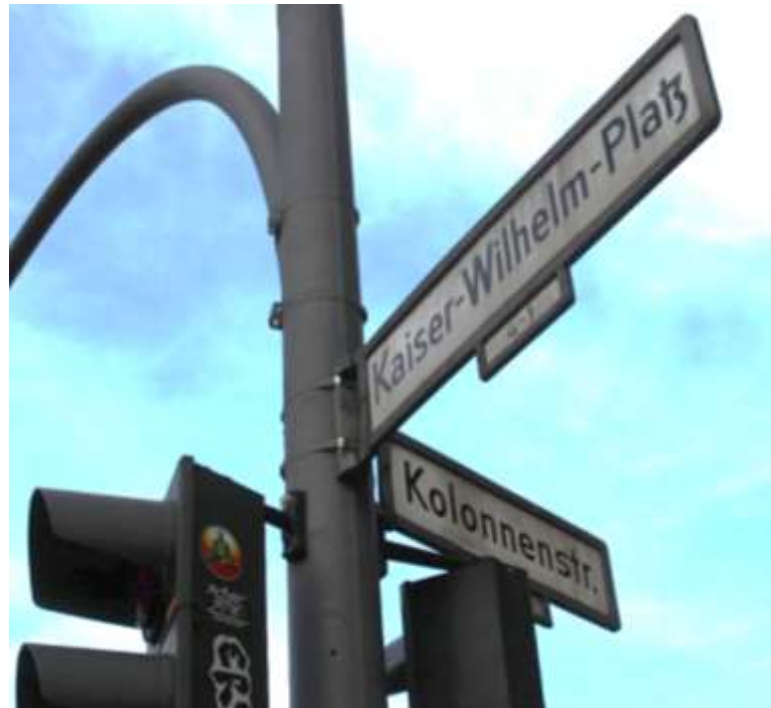
Kaiser-Wilhelm-Platz Ecke Kolonnenstraße, diese führt zum Flughafen Tempelhof