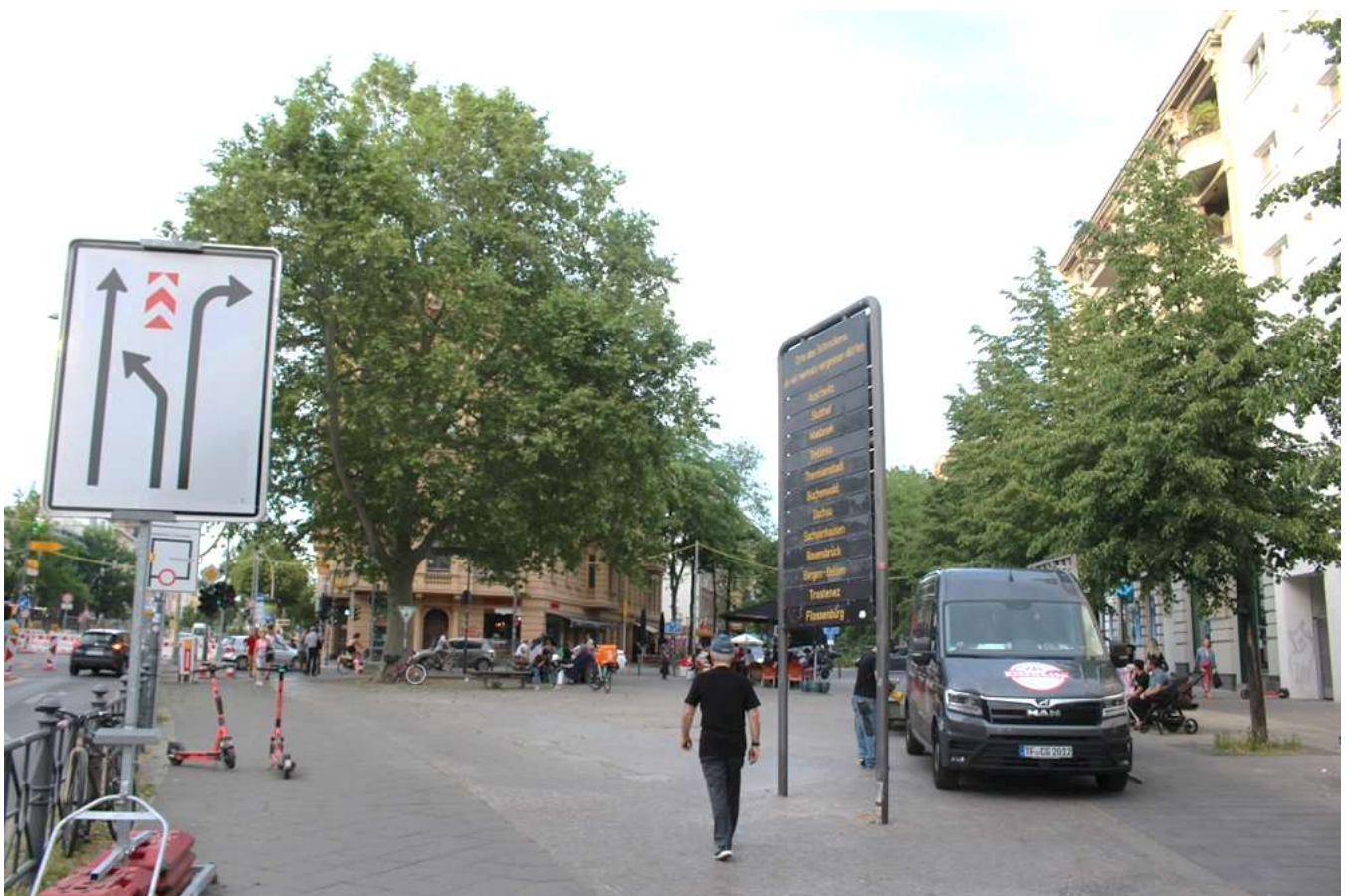
Kaiser-Wilhelm-Platz: Blick Richtung Crelle und Kolonnenstraße, linker Bildrand Hauptstraße, rechts die zum Platz gehörenden Gebäude, wo einst auch das Schöneberger Rathaus stand