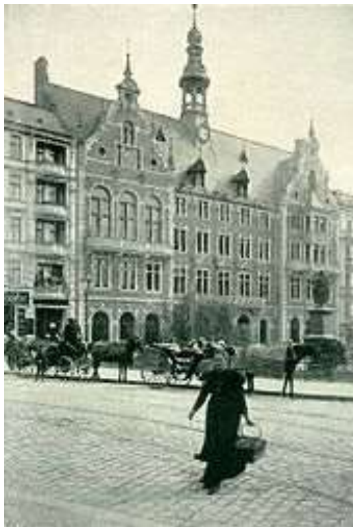
Historisches Foto des ehemaligen Schöneberger Rathauses am Kaiser-Wilhelm-Platz, um 1895

Auf der östlichen Seite des Kaiser-Wilhelm-Platzes befand sich seit 1874 das alte Schöneberger Rathaus . Nach Fertigstellung des neuen Rathaus Schöneberg am damaligen Rudolph-Wilde-Platz (dem späteren John-F.-Kennedy-Platz ) im Jahr 1914, wurde das Gebäude anderweitig genutzt und im Zweiten Weltkrieg zerstört.