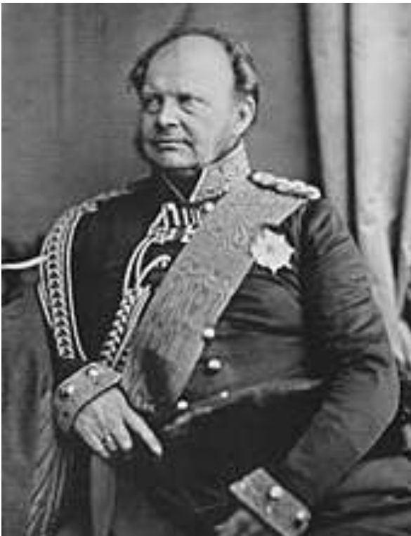
König Friedrich Wilhelm IV. , Bruder Wilhelms I.