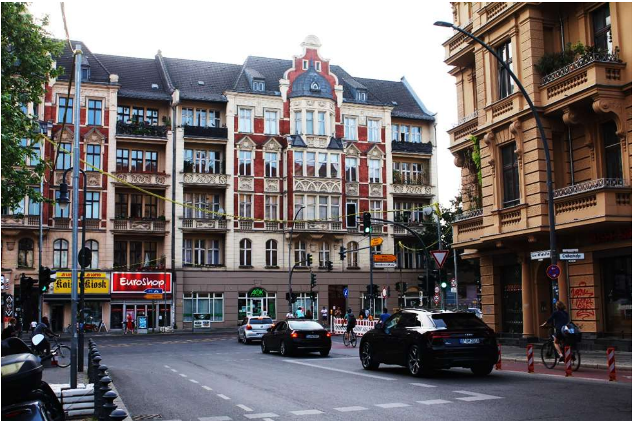
Blick durch die Kolonnenstraße zur Hauptstraße (Reichsstraße 1)