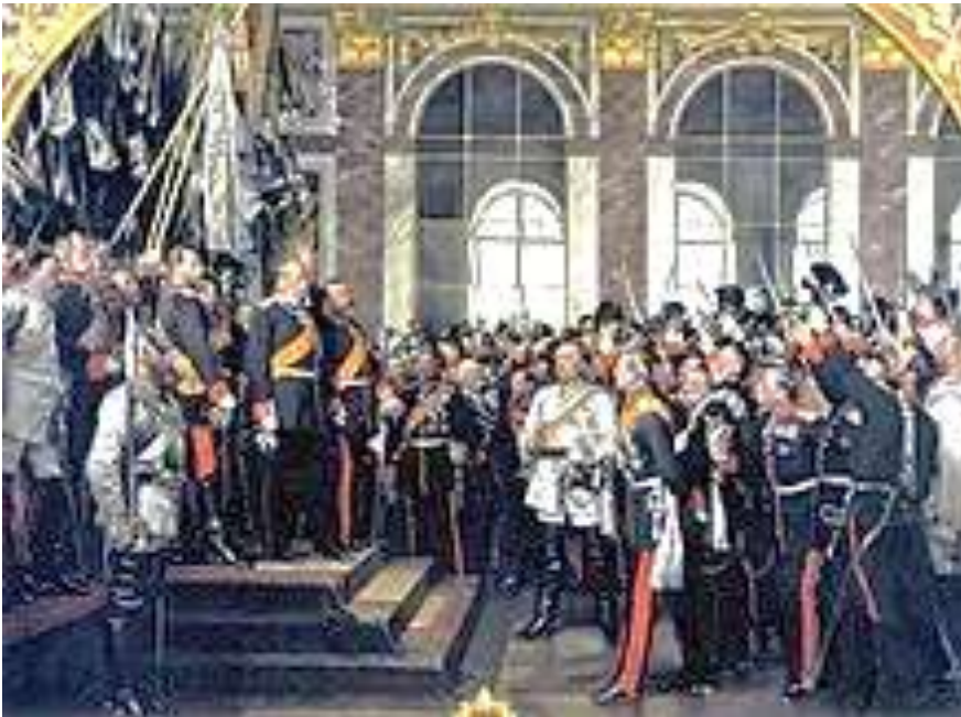
Proklamierung des Deutschen Kaiserreiches, Gemälde von Anton von Werner , 1885

Durch die Kaiserproklamation , die am 18. Januar 1871, dem 170. Jahrestag der Königskrönung Friedrichs III. von Brandenburg , im Spiegelsaal des Schlosses von Versailles stattfand, nahm Wilhelm für sich und seine Nachfolger zur Krone Preußens den Titel eines Deutschen Kaisers an und versprach, „allzeit Mehrer des Deutschen Reichs zu sein, nicht an kriegerischen Eroberungen, sondern an den Gütern und Gaben des Friedens auf dem Gebiet nationaler Wohlfahrt, Freiheit und Gesittung“. Der Proklamation war ein erbitterter Streit über den Titel zwischen Bismarck und König Wilhelm vorausgegangen. Wilhelm fürchtete, dass die deutsche Kaiserkrone die preußische Königskrone überschatten würde. Am Vorabend der Proklamation meinte er: