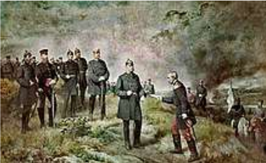
Nach der Schlacht bei Sedan, Gemälde von Carl Steffek , 1884

Die erste Gelegenheit zu Erfolgen in der Deutschlandpolitik bot der Deutsch-Dänische Krieg von 1864, in dem Preußen und Österreich gemeinsam als Wahrer deutscher Interessen in den mit Dänemark verbundenen Herzogtümern Schleswig und Holstein auftraten. Wie von Bismarck kalkuliert, kam es nach dem Sieg über die weitere Behandlung Schleswig-Holsteins zum Konflikt mit Österreich, mit dem Preußen damals noch immer um die Führung im Deutschen Bund konkurrierte. Der König erhielt das Siegestelegramm von der Schlacht bei Düppel auf der Rückfahrt von einer Truppeninspektion auf dem Tempelhofer Feld . Augenblicklich kehrte er um, um den Soldaten die Siegesbotschaft zu verkünden. Im Anschluss fuhr er zum Kriegsschauplatz, wo er am 21. April 1864, bei einer Parade auf einer Koppel zwischen Gravenstein und Atzbüll , den „Düppelstürmern“ persönlich dankte. [12]