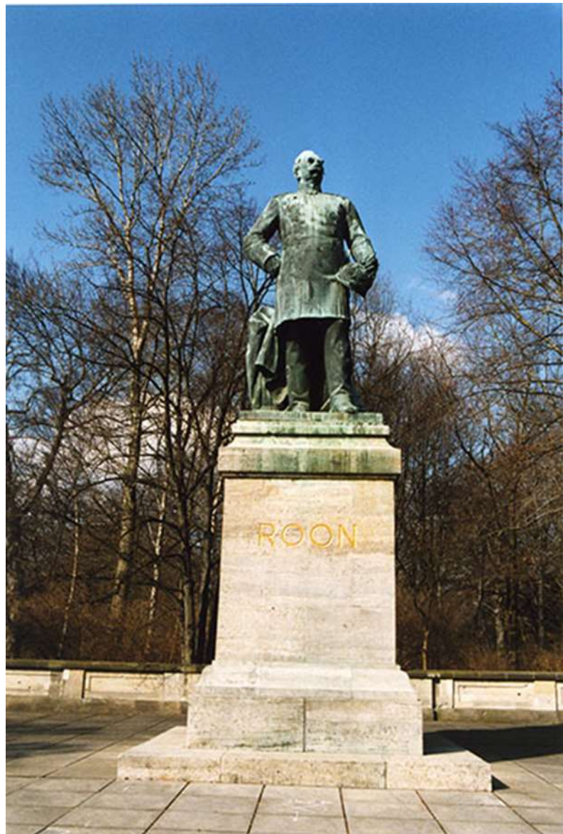
Aus: Berliner Woche (Steglitz-Dahlem) Roon-Denkmal am Großen Stern, v. 12.05.2021, S. 2 < https://bildhauerei-in-berlin.de/bildwerk/roon-denkmal/ >

Und es werden nicht nur alle nach Roon benannten Straßen betroffen sein, sondern auch die benachbarten Straßen die nach preußischen Militärs benannt sind. Und natürlich auch das Roon-Denkmal am Großen Stern.