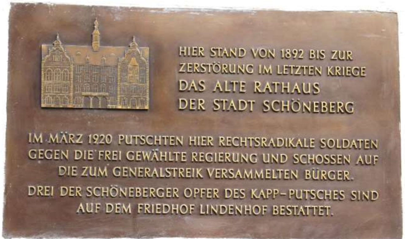
Gedenktafel an einem der wenigen Gebäude, die zum Kaiser-Wilhelm-Platz gehören