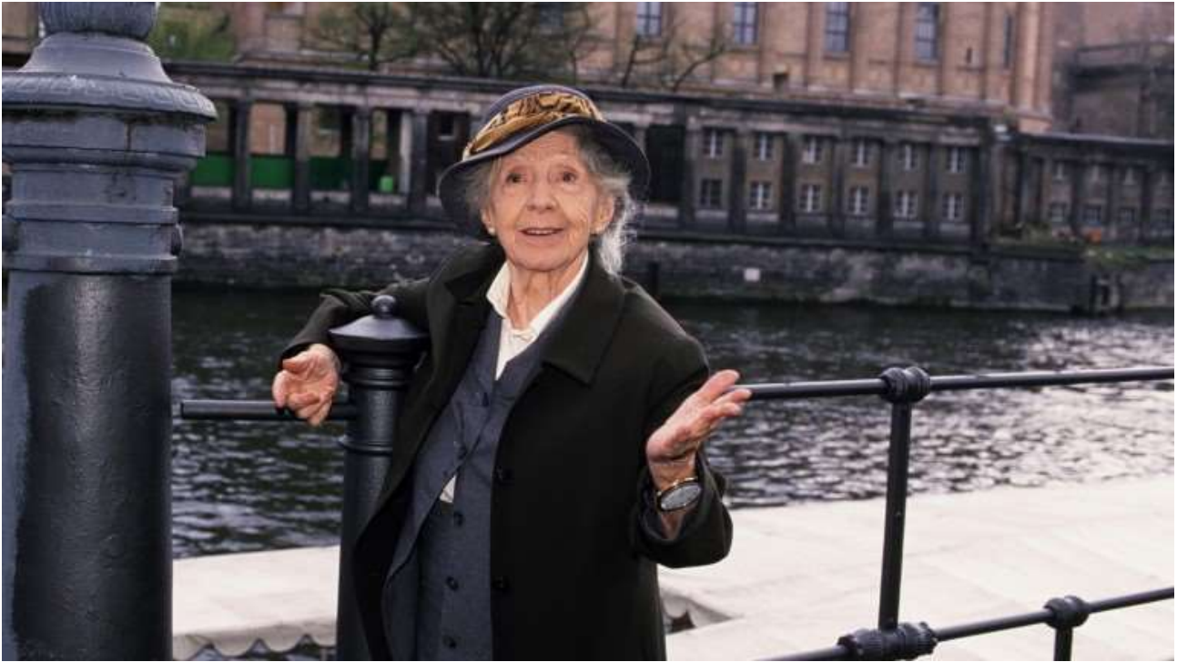
Inge Meysel in Berlin.