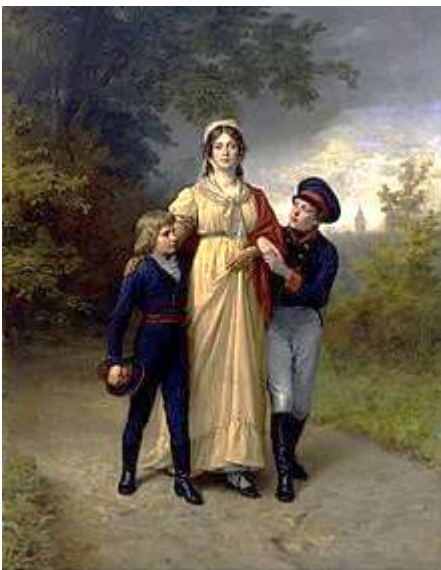
Königin Luise mit Prinz Wilhelm (links) und Kronprinz Friedrich Wilhelm (rechts), Gemälde von Carl Steffek , 1886