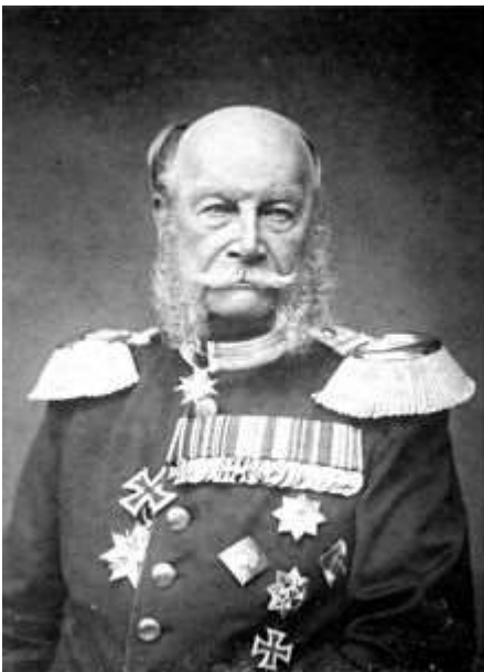
Wilhelm I. auf einem Porträt des Hoffotografen Wilhelm Kuntzemüller (1884)