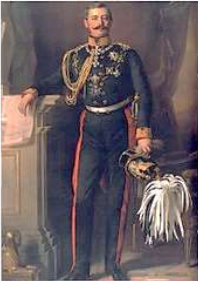
Karl Anton Fürst von Hohenzollern-Sigmaringen