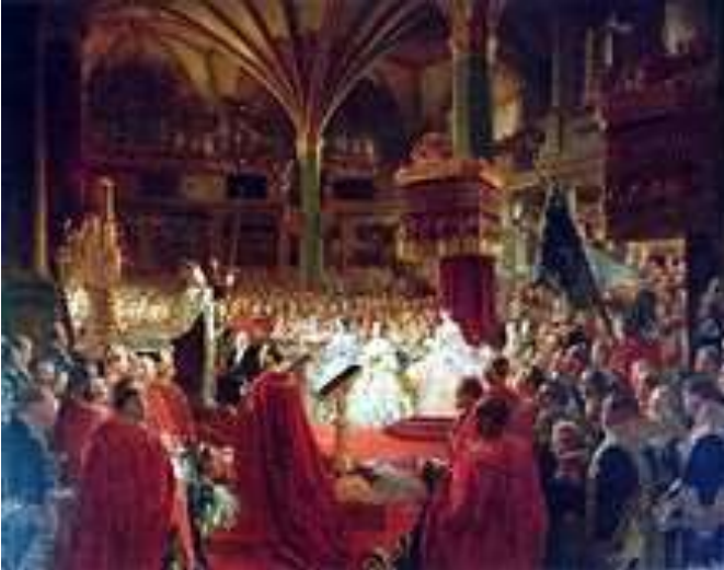
Krönung Wilhelms I. zum König in Königsberg, Gemälde von Adolph Menzel , 1861

Nach dem Tod seines Bruders Friedrich Wilhelm IV. am 2. Januar 1861 bestieg Wilhelm den preußischen Thron. Mit der von ihm selbst auf eigene Kosten veranstalteten Krönung meinte Wilhelm einen Kompromiss zwischen der nicht in der Verfassung vorgesehenen, aber von ihm gewünschten Erb huldigung , und der dort vorgeschriebenen Eidesleistung im Parlament gefunden zu haben. [10] Im Aufruf an mein Volk vom 8. Januar 1861 bekräftigte er seine Treue zum Eid auf die Verfassung, den er bereits 1858 als Prinzregent abgelegt hatte. Am 18. Oktober 1861 fand die prachtvolle Krönungsversammlung in Königsberg in der Schlosskirche statt.