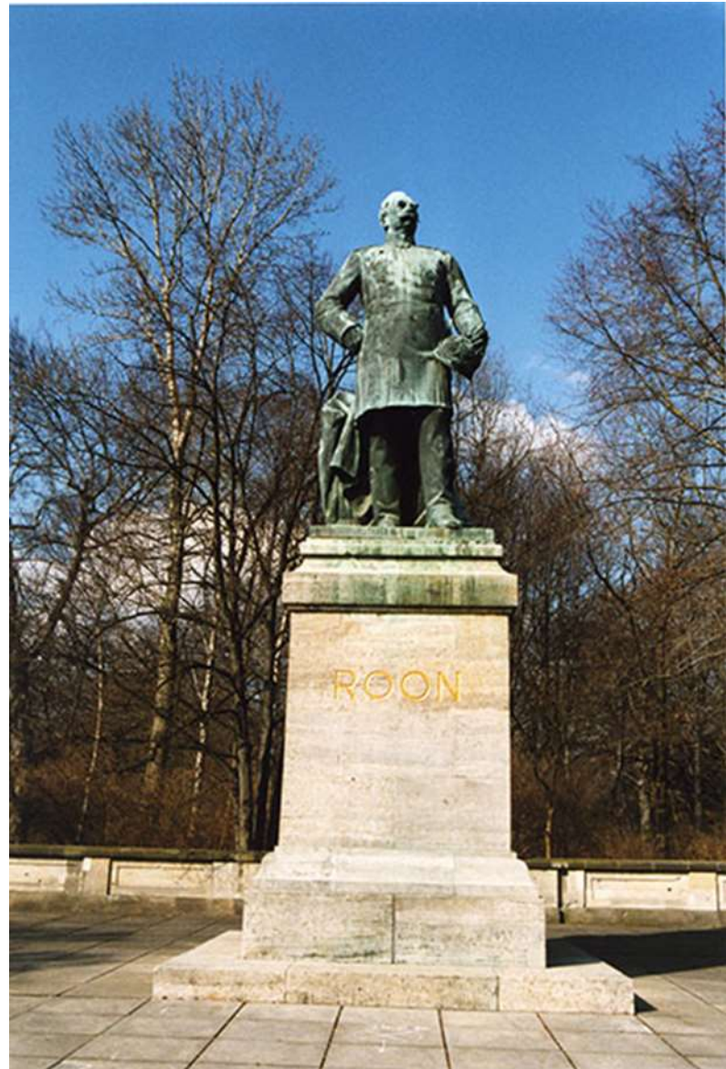
Aus: Berliner Woche (Steglitz-Dahlem) Roon-Denkmal am Großen Stern, v. 12.05.2021, S. 2 < https://bildhauerei-in-berlin.de/bildwerk/roon-denkmal/ >

Und es werden nicht nur alle nach Roon benannten Straßen betroffen sein, sondern auch die benachbarten Straßen die nach preußischen Militärs benannt sind. Und natürlich auch das Roon-Denkmal am Großen Stern.