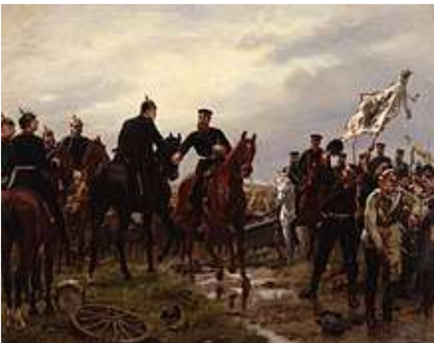
Nach der Schlacht bei Königgrätz, Gemälde von Emil Hünten , 1886