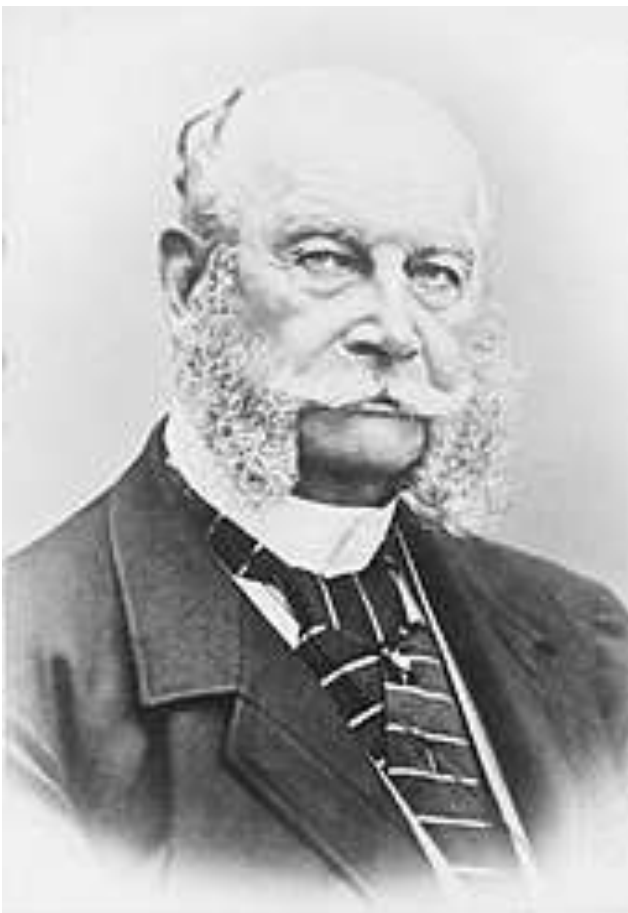
Wilhelm I. in Zivil, nach 1871

[Wird hier ausgespart! Vielleicht für später!]