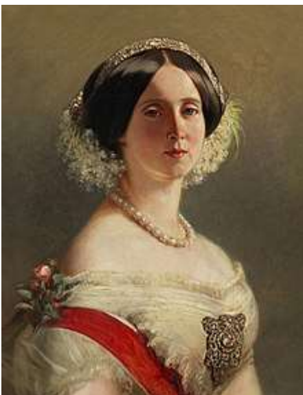
Augusta von Sachsen-Weimar-Eisenach