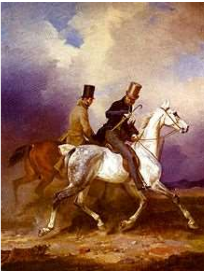
Ausritt des Prinzen Wilhelm von Preußen in Begleitung des Malers, Gemälde von Franz Krüger , 1836