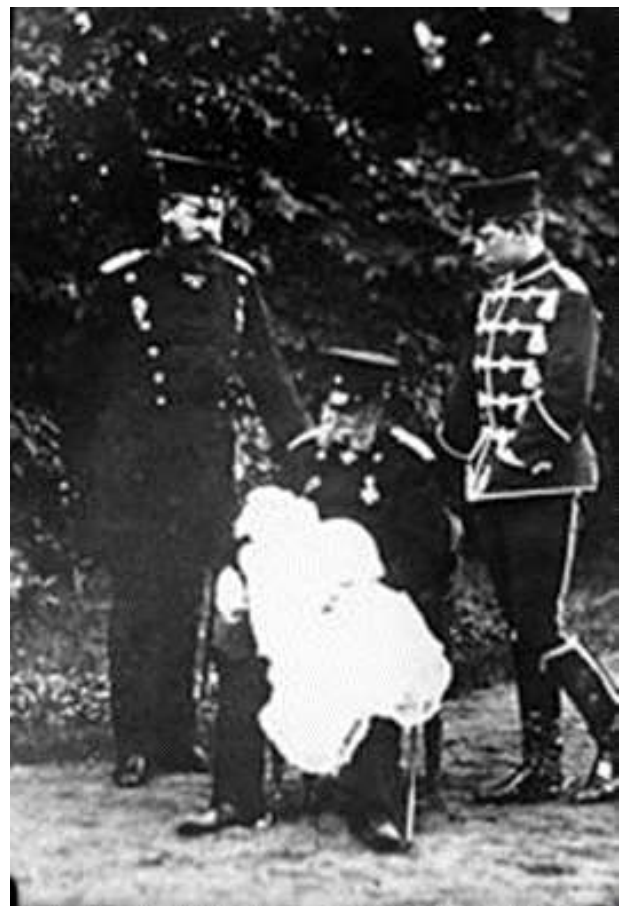
Kaiser Wilhelm I. mit Sohn, Enkel und Urenkel, 1882