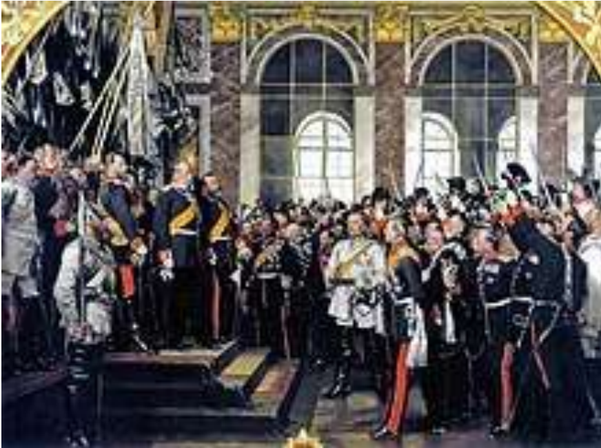
Proklamierung des Deutschen Kaiserreiches, Gemälde von Anton von Werner , 1885

Durch die Kaiserproklamation , die am 18. Januar 1871, dem 170. Jahrestag der Königskrönung Friedrichs III. von Brandenburg , im Spiegelsaal des Schlosses von Versailles stattfand, nahm Wilhelm für sich und seine Nachfolger zur Krone Preußens den Titel eines Deutschen Kaisers an und versprach, „allzeit Mehrer des Deutschen Reichs zu sein, nicht an kriegerischen Eroberungen, sondern an den Gütern und Gaben des Friedens auf dem Gebiet nationaler Wohlfahrt, Freiheit und Gesittung“. Der Proklamation war ein erbitterter Streit über den Titel zwischen Bismarck und König Wilhelm vorausgegangen. Wilhelm fürchtete, dass die deutsche Kaiserkrone die preußische Königskrone überschatten würde. Am Vorabend der Proklamation meinte er: