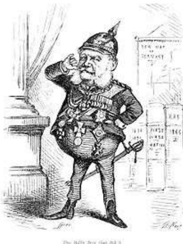
Karikatur Wilhelms I. von Thomas Nast