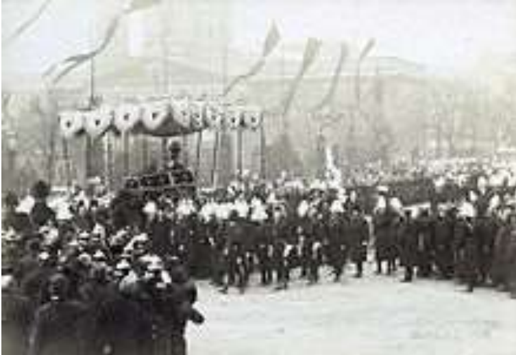
Trauerzug für Wilhelm I. im Berliner Lustgarten , 1888

Wilhelm, der im hohen Alter hohe Popularität genoss und für viele das alte Preußen verkörperte, starb nach kurzer Krankheit im Dreikaiserjahr am 9. März 1888 im Alten Palais Unter den Linden und wurde am 16. März im Mausoleum im Schlosspark Charlottenburg beigesetzt.