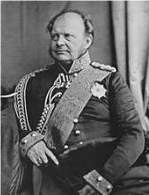
König Friedrich Wilhelm IV. , Bruder Wilhelms I.