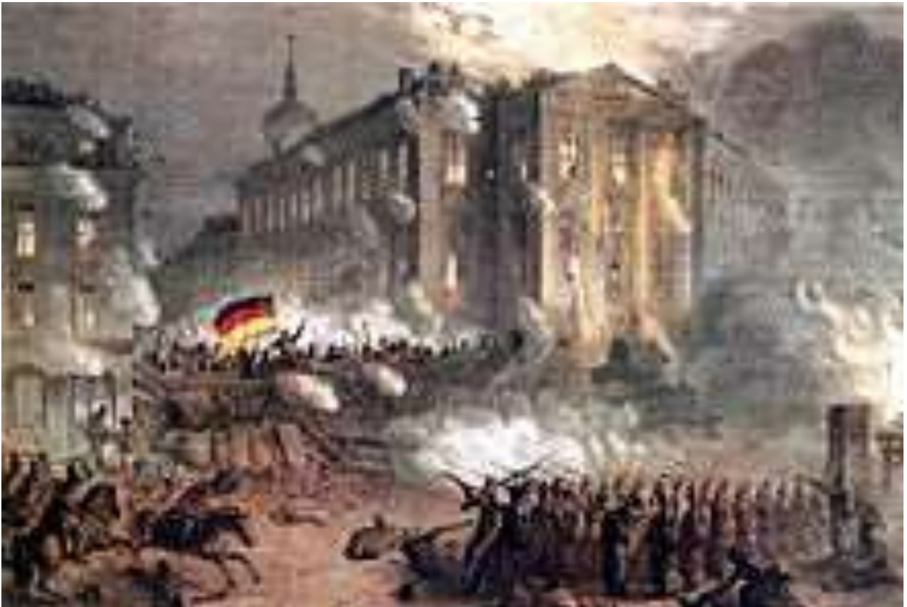
Märzrevolution 1848 in Berlin