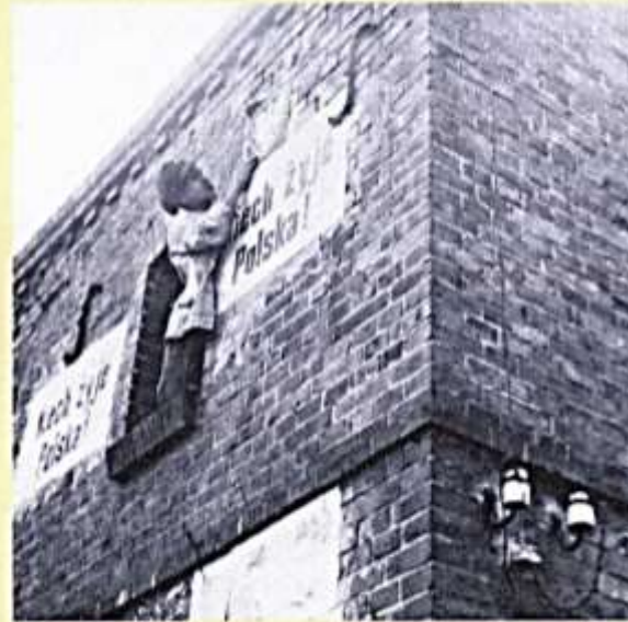
Im Vorfeld der Volksabstimmung 1920 versuchten Deutsche und Polen, das Ergebnis der Abstimmung durch Propaganda zu beeinflussen. Hier bringt ein Mann pro-polnisch Plakate an einem Gebäude in der Stadt Stuhm an: „Es lebe Polen!“

Die Wucht der Vertragsbestimmungen traf das Deutsche Reich hart. Neben anderen Abtretungen waren es vor allem die Gebietsverluste im Osten, die weitreichende Folgen für Politik, Gesellschaft und Wirtschaft hatten.