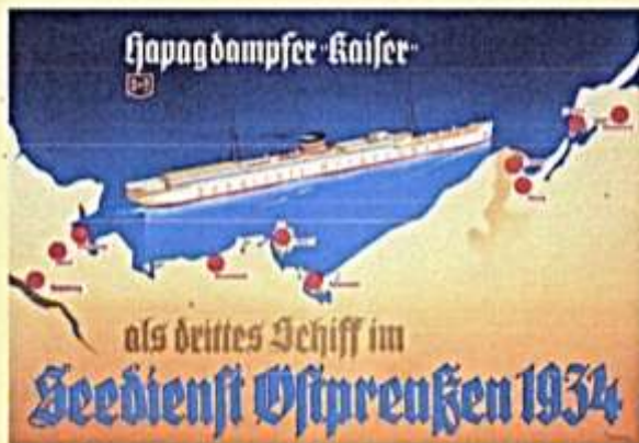
Mit den Schiffen des Seedienst Ostpreußen wurden Mitte 1930 über 160.000 Abstimmungsbezügliche nach Ost- und Westpreußen gebracht. Fotobibliographie, 1934

Besonders die in den Verträgen beschlossenen territorialen Bestimmungen führten zu gewaltigen politischen und sozialen Umwälzungen: 14 neue Staaten entstanden, es gab 11.000 Kilometer neue Außengrenzen. Damit verbunden kam es zu Zwangswanderungen bisher nicht gekanntes Ausmaßes: Mitte der 1920er Jahre lag die Zahl der Flüchtlinge, Vertriebenen und Umsiedler bei fast zehn Millionen Menschen. Allein die Mittelmächte hatten mindestens zwei Millionen Menschen aus ihren verloren gegangenen Territorien aufzunehmen.