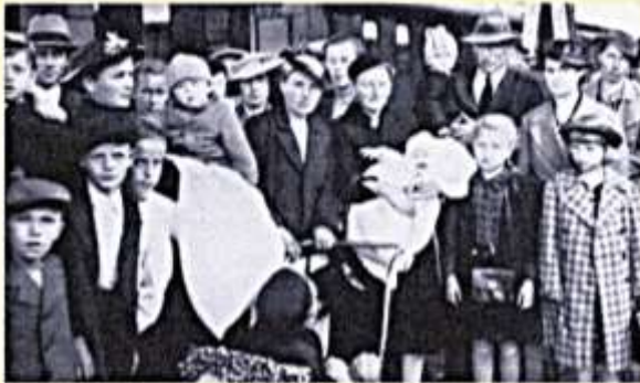
Deutsche Abwanderer aus Westpreußen, Hunderttausende Menschen verließen aufgrund der Bestimmungen des Versailler Vertrages die 1920 polnisch gewordenen Gebiete.

Vor genau 100 Jahren trat der Versailler Vertrag in Kraft. Nachdem der Erste Weltkrieg Millionen von Menschenleben gefordert hatte, schufen die Friedensschlüsse zwischen der Entente und den Mittelmächten – die Pariser Vorortverträge – eine neue Friedensordnung für Europa. Die Regelungen führten aber auch zu radikalen politischen, wirtschaftlichen und sozialen Umwälzungen.