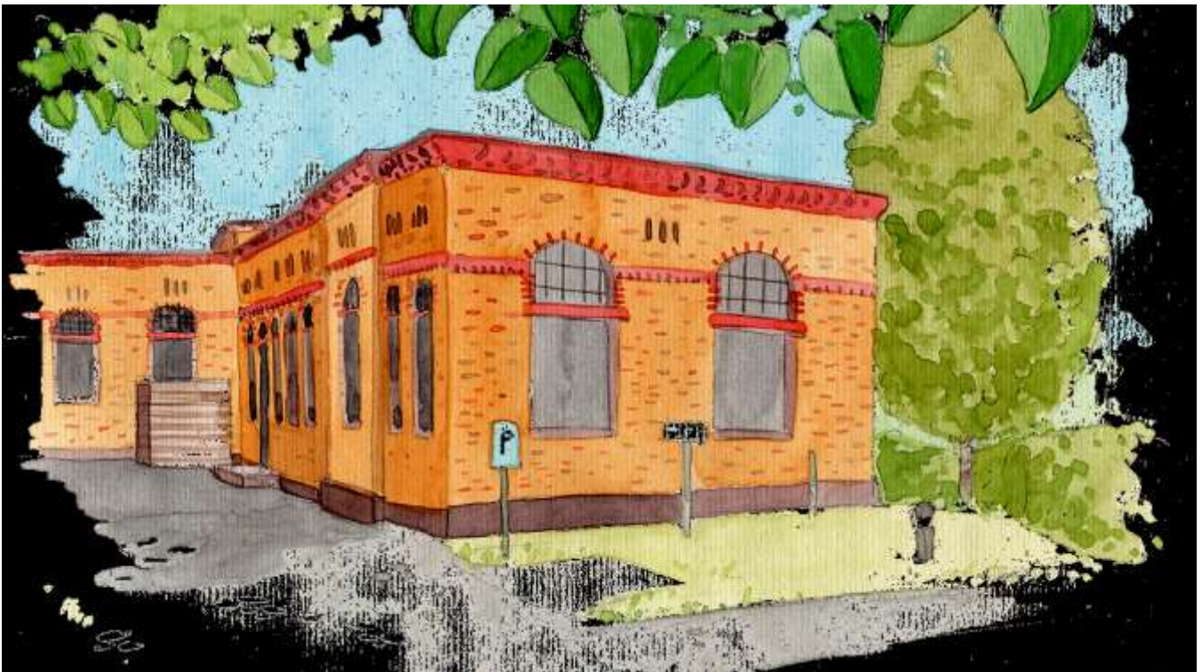
Bild: Unser Dienstsitz in Potsdam in den einstigen Ställen der ehemaligen Garde du Corps-Kaserne. Aquarell: Ulrike Niedlich, 2019 © Deutsches Kulturforum östliches Europa

Foto: Collage mit Screenshots unserer Social Media-Kanäle: © Deutsches Kulturforum östliches Europa, 2020. S. Aberle