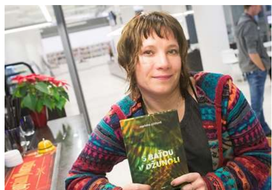
zdeněk němec | mafra Markéta Pilátová