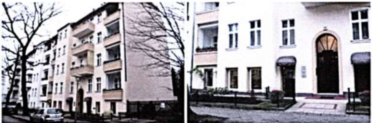
Unsere Geschäftsstelle im Sockelgeschoss des Hauses Brandenburgische Straße 24 in Steglitz, Kontakt zur Wohnbevölkerung und zu den Vorbeiwandernden ist selbstverständlich!