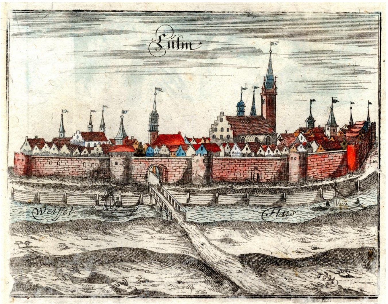
Die Hansestadt Kulm, 1684 Teilkolorierter Kupferstich J. Vogel