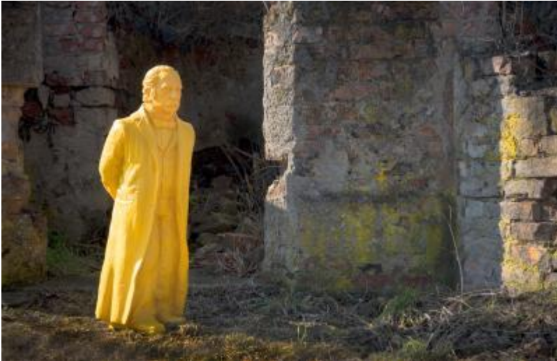
Theodor Fontane in Küstrin