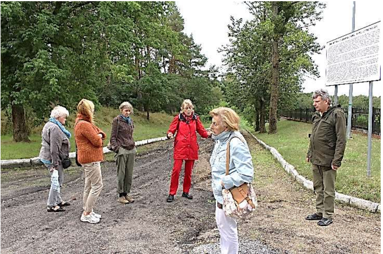
Wir reden miteinander