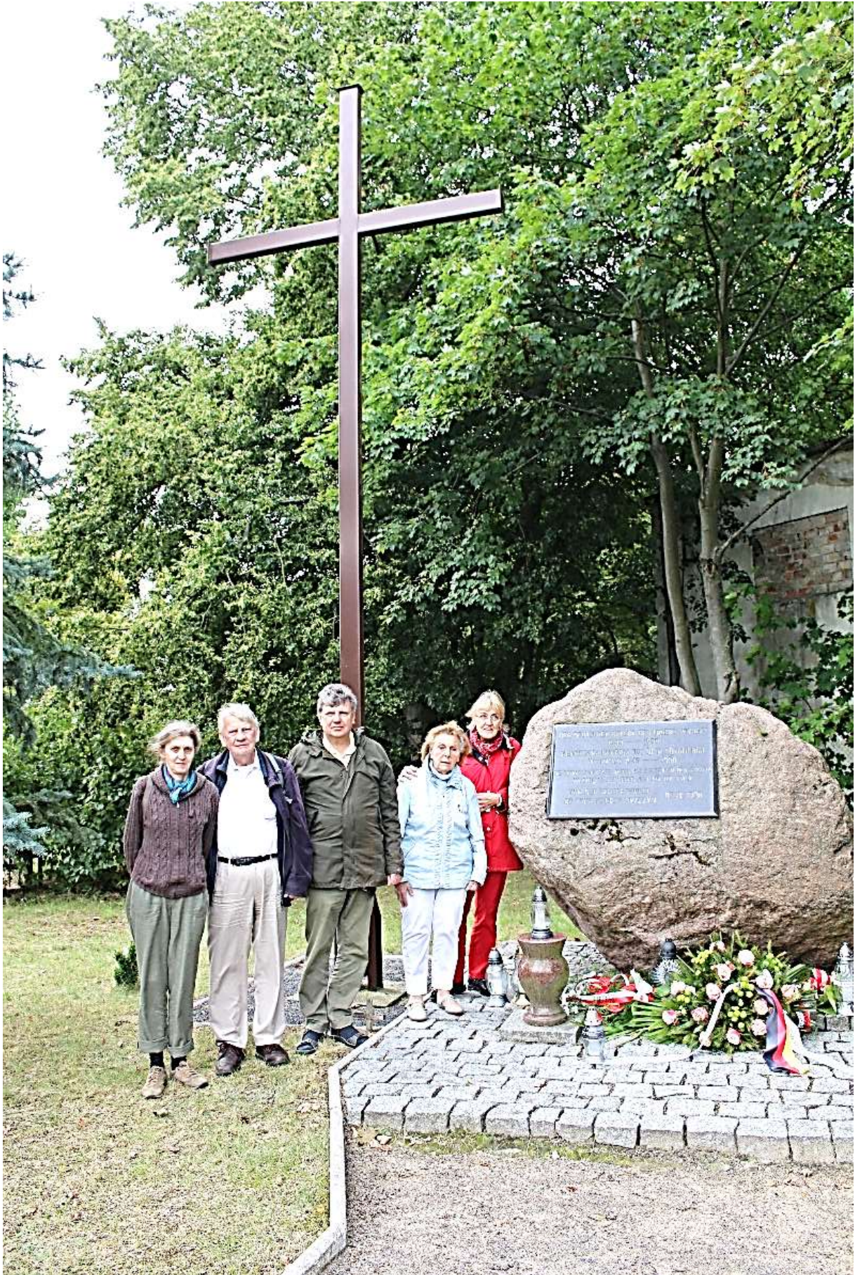
Gedenken für deutsche Opfer 1945 ff. und die Gedenktafel ...