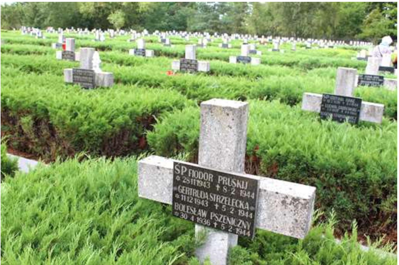
Das polnische Gräberfeld der Opfer