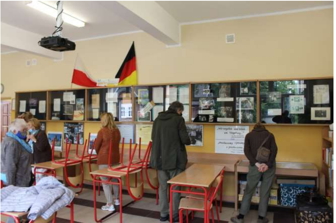
Im Gedenkraum der Schule