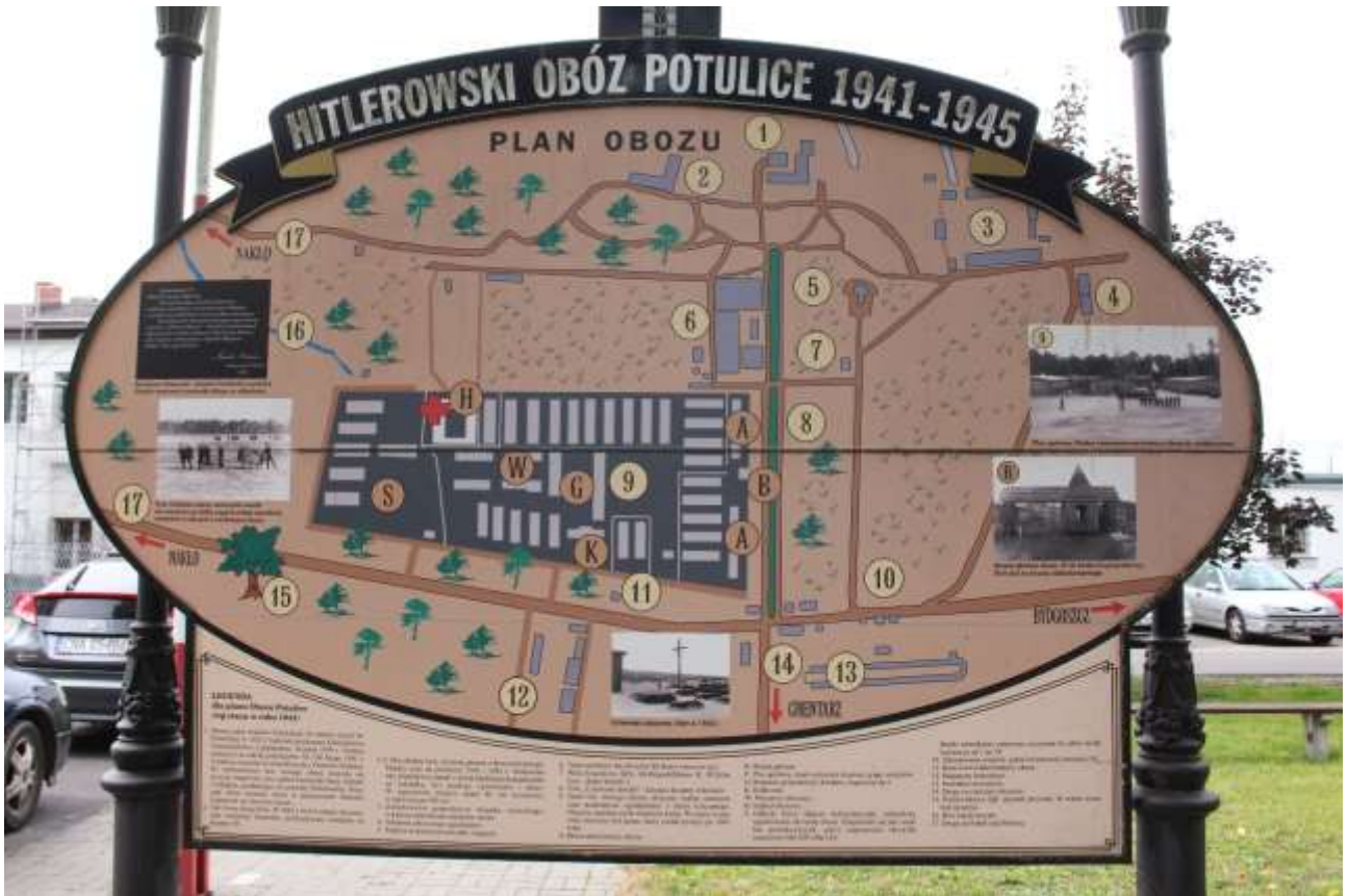
Informationstafel zum Lager 1941-1945 vor dem Eingang zum Gefängnis dahinter