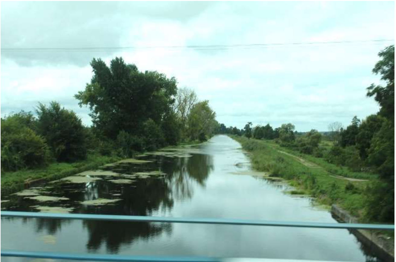
Die Netze bei Potulitz

Dienstag, 01. September 2020: Teil 1: Potulitz