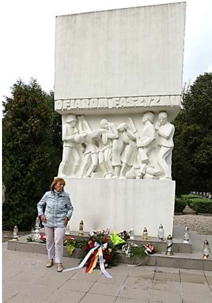
Gedenken für die polnischen Opfer 1939-1945