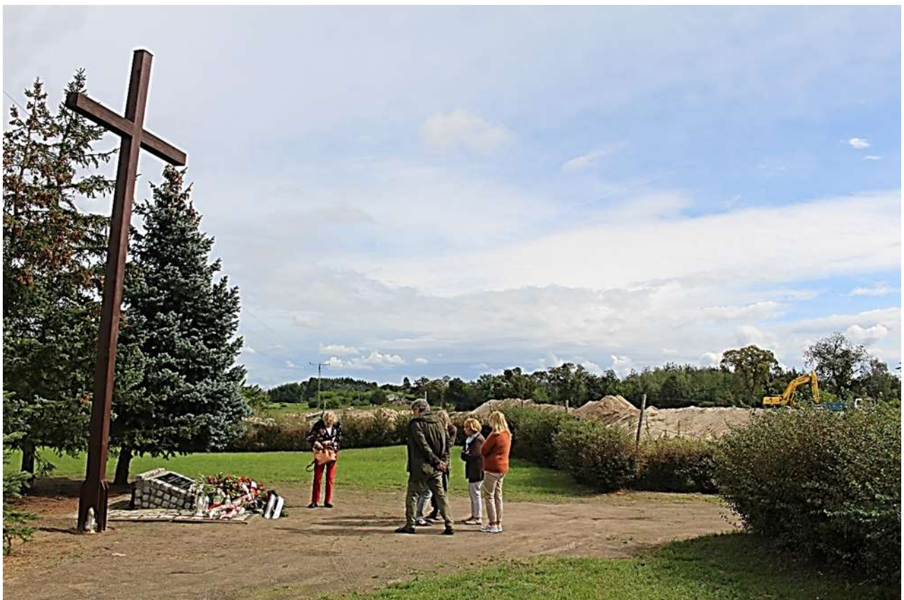
Gedenken für die deutschen Opfer außerhalb von Potulitz