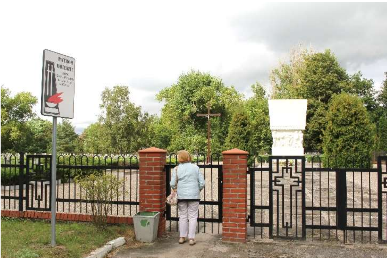
Potulitz: Friedhof der polnischen Opfer – Gräber und Denkmal