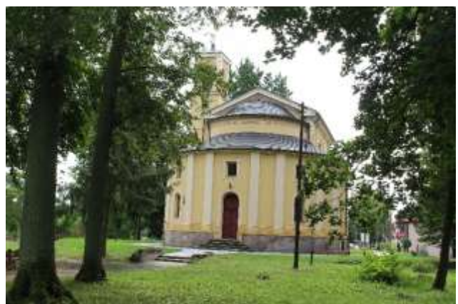
Potulitz: Schloss und Kapelle