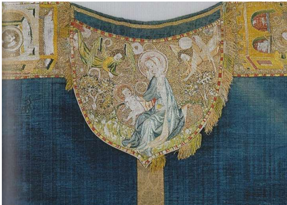
Paramente aus: B. Borkopp-Restle, Der Schatz der Marienkirche zu Danzig, S. 103

< www.westpreussen-berlin.de > < danzig.westpreussen.berlin@gmail.com >